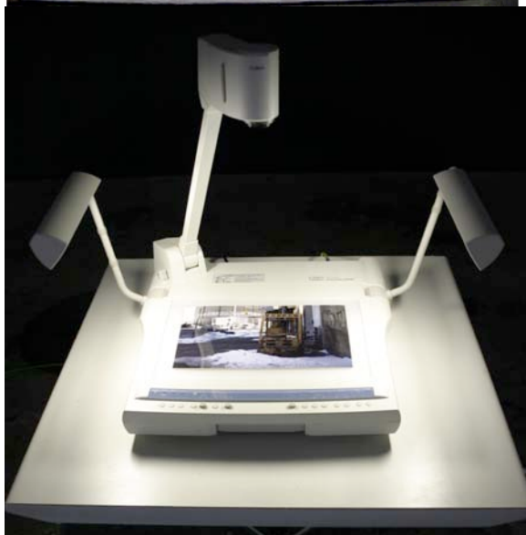
Gaëlle Boucand New York Channel , 2006 Moniteur de contrôle, vidéovisualiseur, tirage argentique A4 Dimensions variables