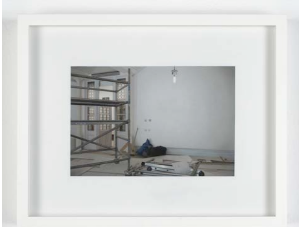
Andrew Grassie After the Archive Collections Room , 2009 Tempera on paper on board 12 x 18 cm Collection Kadist Art Foundation