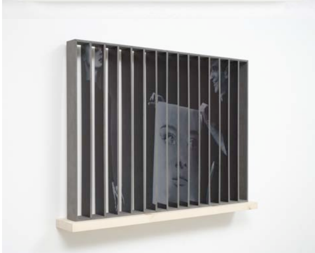
Riccardo Previdi Audrey (Funny Face) , 2007 MDF, wood, inkjet print on pvc 66 cm x 93,8 cm x 12,4 cm Ed. 1/3