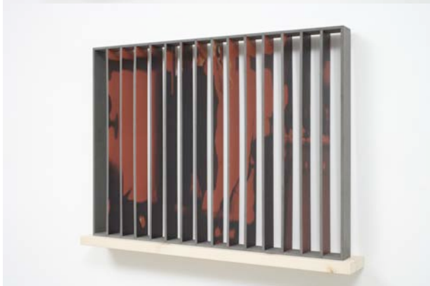
Riccardo Previdi Audrey (Funny Face) , 2007 MDF, wood, inkjet print on pvc 66 cm x 93,8 cm x 12,4 cm Ed. 1/3