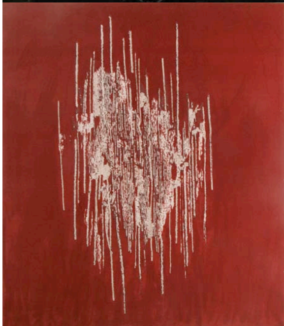
Peggy Buth untitled (shaved red carpet) , 2008 tissu, bois 200 x 255 cm