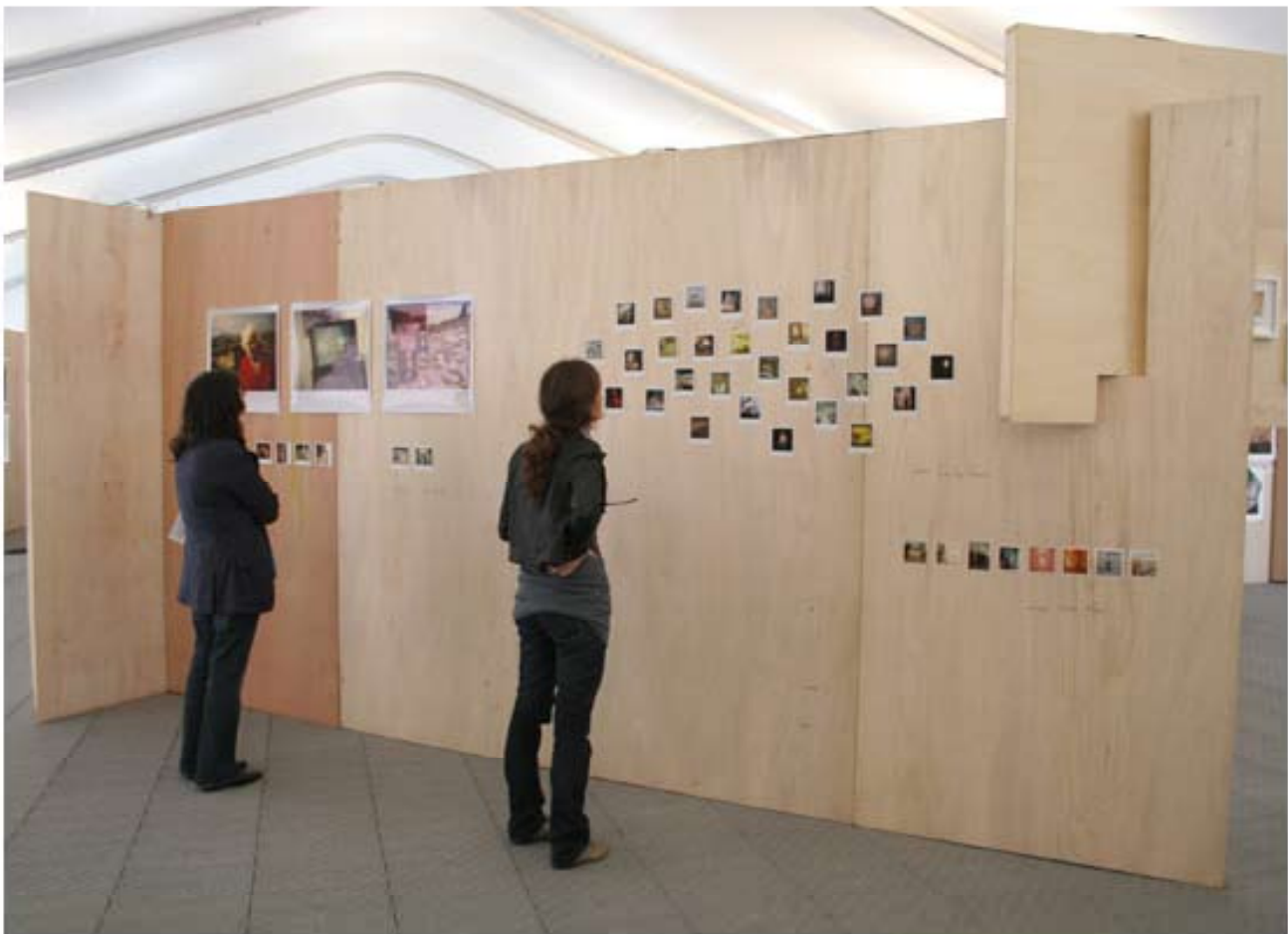
"Magic Trick," a collection of Polaroid pictures curated by Véronique Bourgoïn at the Tobacco Warehouse

The Tobacco Warehouse, which has also housed Art + Commerce's Emerging Photographer Festival in 2004 and 2005, is now home to the satellite show. Peek around and a glorious smattering of SX-70 Polaroids can be found, lovingly curated by French artist Véronique Bourgoïn. Made with instant film that is no longer in production, these types of Polaroids have always transported their subjects back at least thirty years, if not passing them into a secret nether-decade between 1972-1984. Nudes tend to do especially well with this technique, of which there are quite a few here, though almost eclipsing the other subject matter.