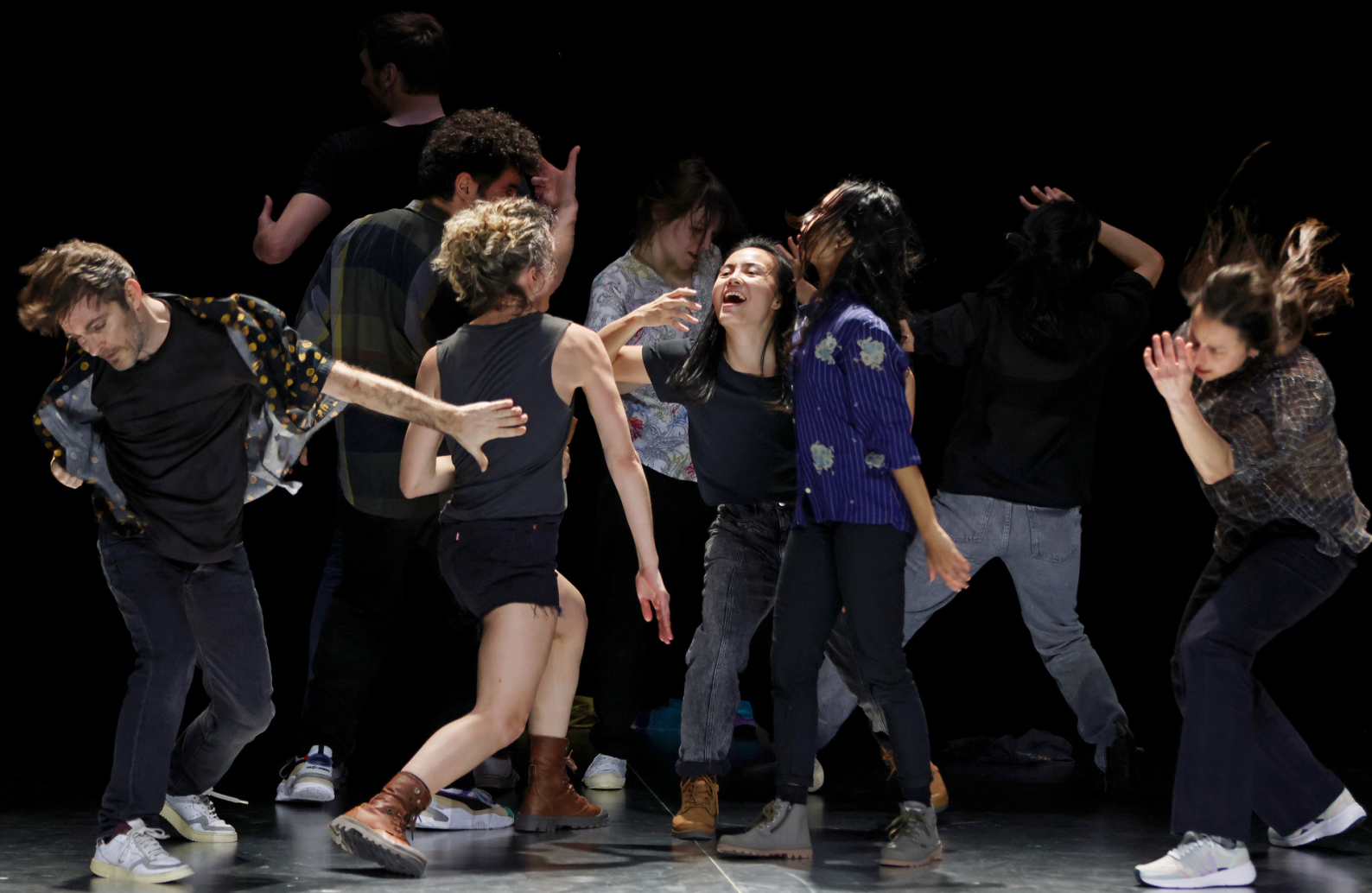
People united WLDN/Joanne Leighton