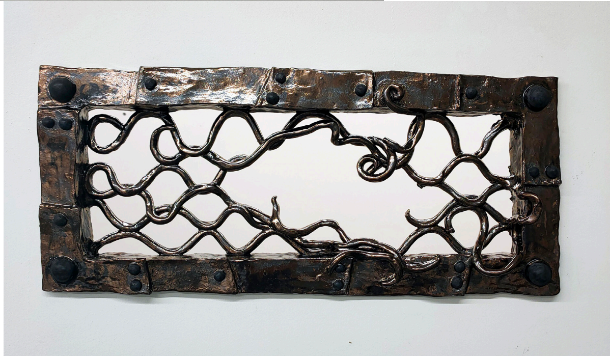
Lou Masduraud, Plans d'évasion, system soupir , Maison populaire - 2021