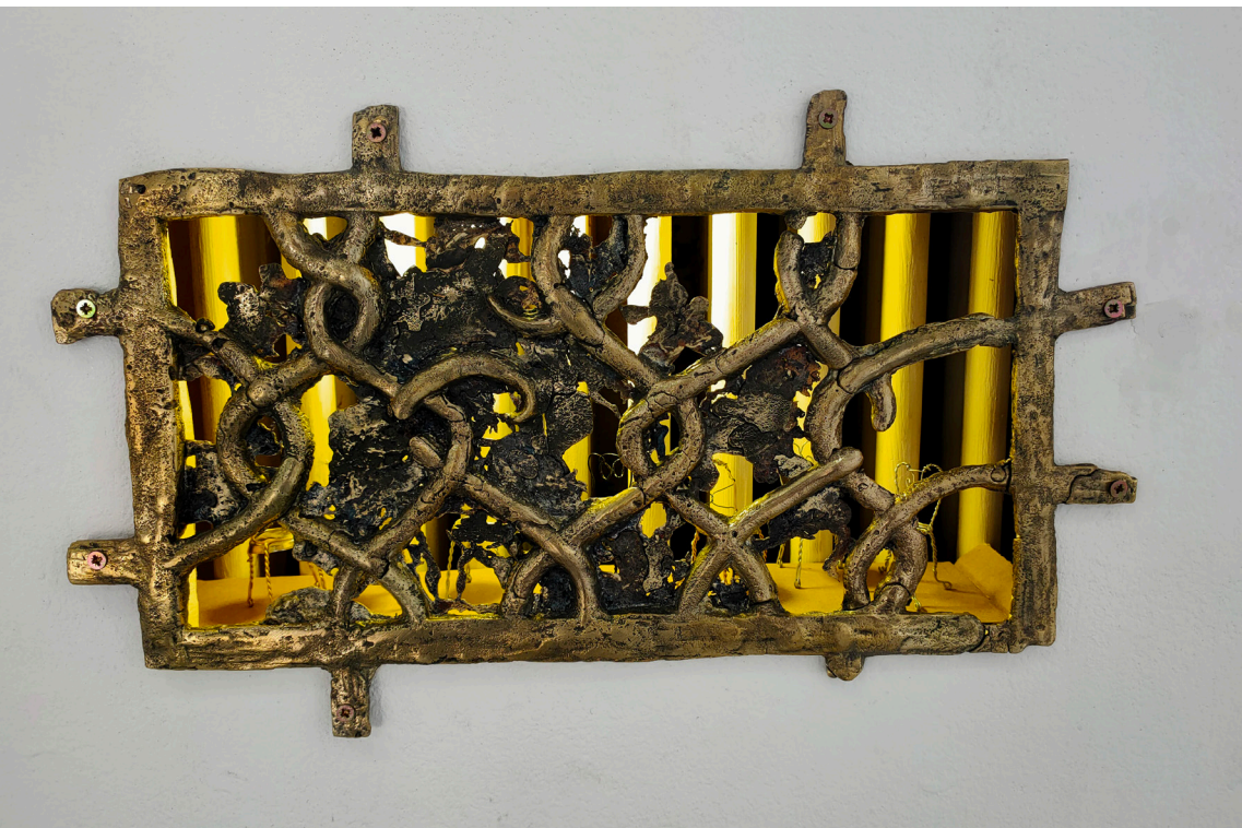
Lou Masduraud - Plan d'évasion (general meeting) 2021 Laiton, bouchon de bouteille, fil de fer, lampe led.

Accueillie lors de la Nuit Blanche 2020 à la Maison pop avec l'installation JouvencX , Lou Masduraud présente en cet automne 2021 system soupir , une prise de pouvoir spéculative - sur les infrastructures qui permettent la collectivité.