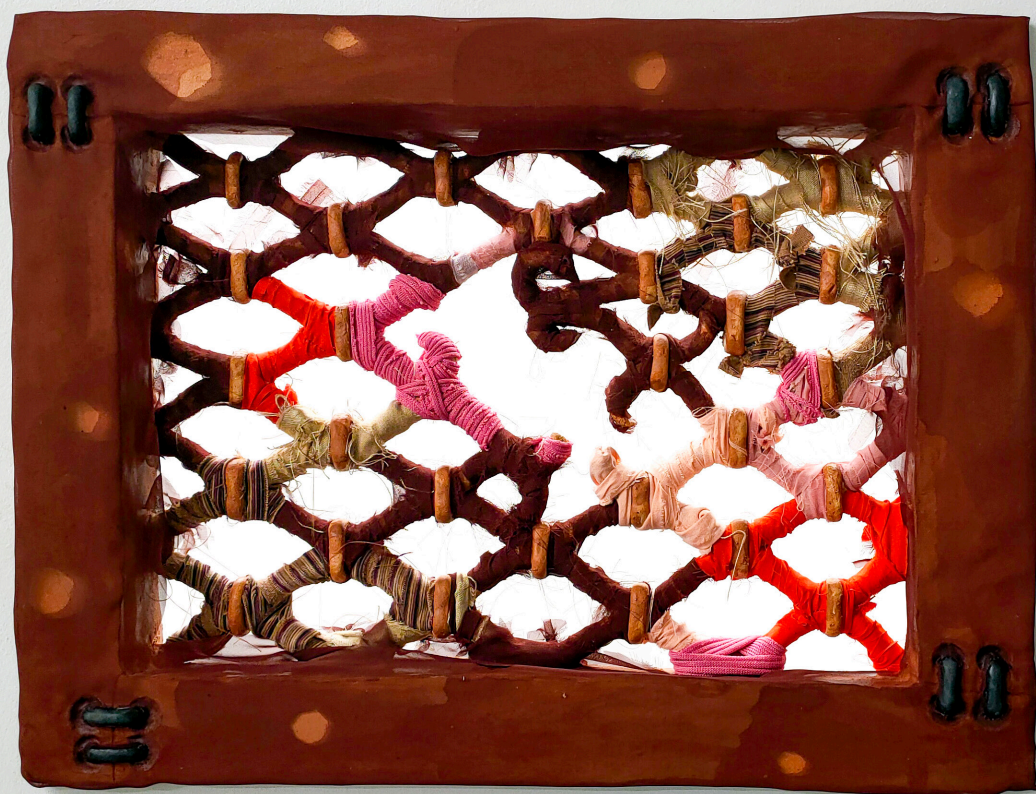
Lou Masduraud, Plans d'évasion, systm soupir Grès émaillé, matériaux divers - Maison populaire - 2021