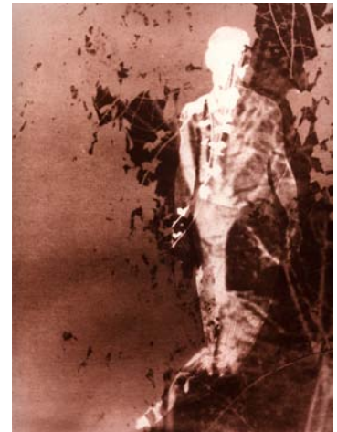
BIRGIT JÜRGENSSEN Ohne Titel / Sans Titre , 1979 Photographie couleur d'après un rayogramme 36 x 29,5 cm