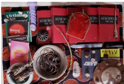
AA BRONSON Project for M , 2010 3 photographiers couleur Dimensions: 55,8 x 76,5 cm Edition de 3 plus 1 artist's proofs (#1/3)