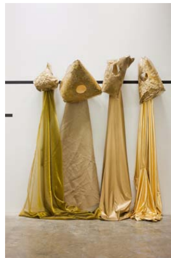
MIKALA DWYER The Collapzars , plastique, peinture, papier mâché, tissu, 2012. Courtesy de l'artiste Crédit : Project Arts Centre, Dublin