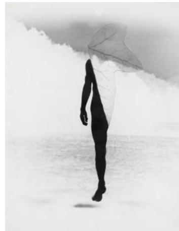
BIRGIT JÜRGENSSEN Ohne Titel (Naturgeschichte) / Untitled (Natural History) 1975 rayogramme 38,5 x 29,5 cm