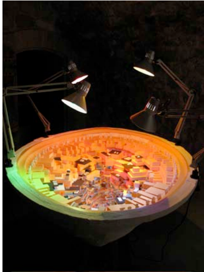
Jan Kopp And this is only the beginning , 2006